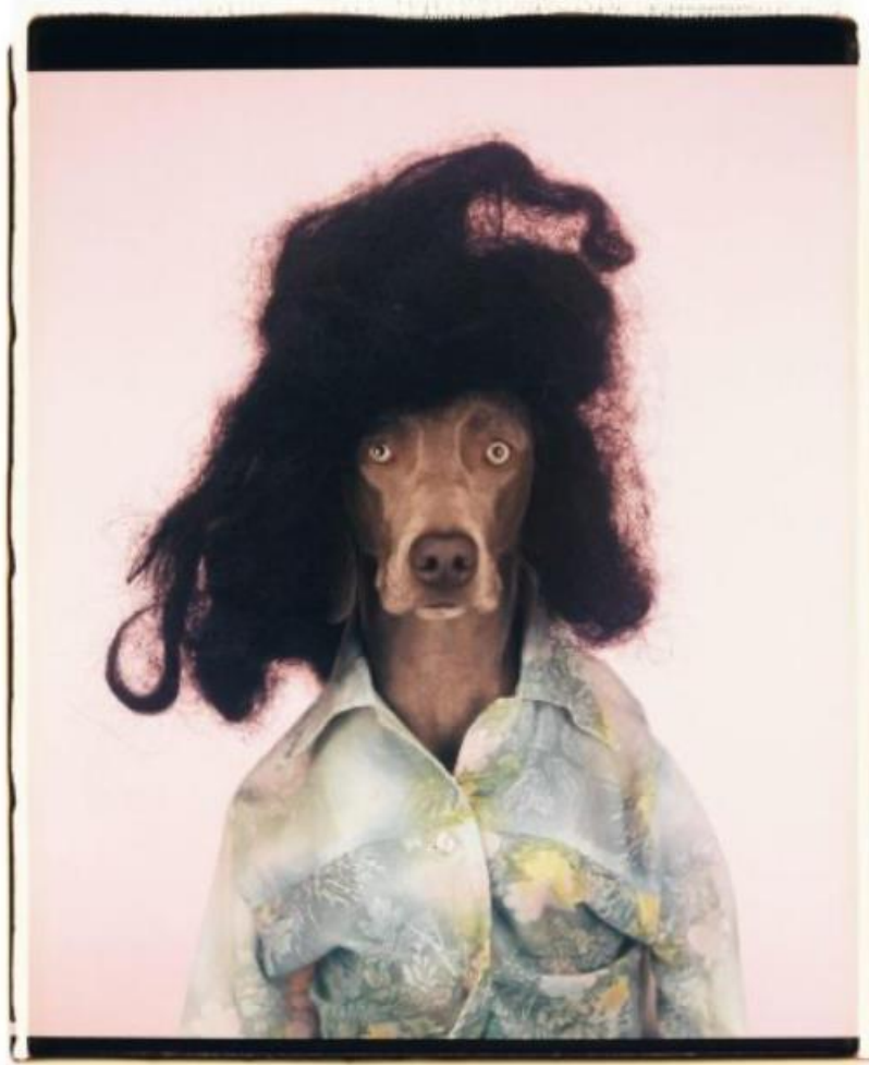
William Wegman, Ionico, 2005