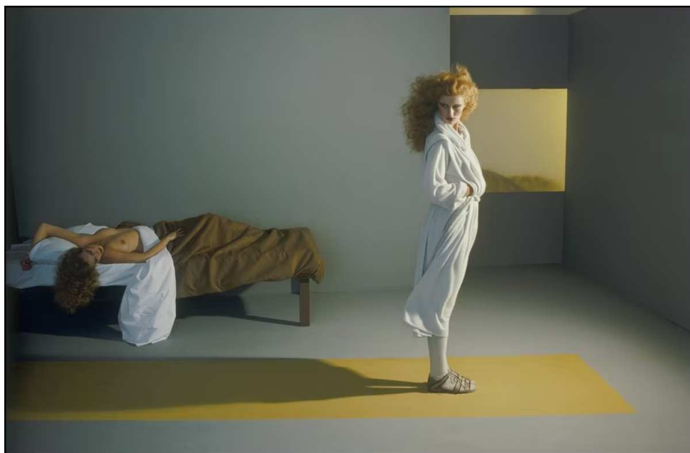
Tribute to Edward Hopper Versace, Gian Paolo Barbieri. Courtesy 29 Arts in Progress Gallery.

Spazio anche importanti mostre . Tra queste, segnaliamo l'omaggio che Mia Photo Fair dedica al fotografo Carlo Bavagnoli con Bavagnoli e i ritratti: omaggio al maestro del fotogiornalismo . E La forma delle relazioni , che indaga il potere relazionale della fotografia con oltre 50 opere provenienti da collezioni italiane.