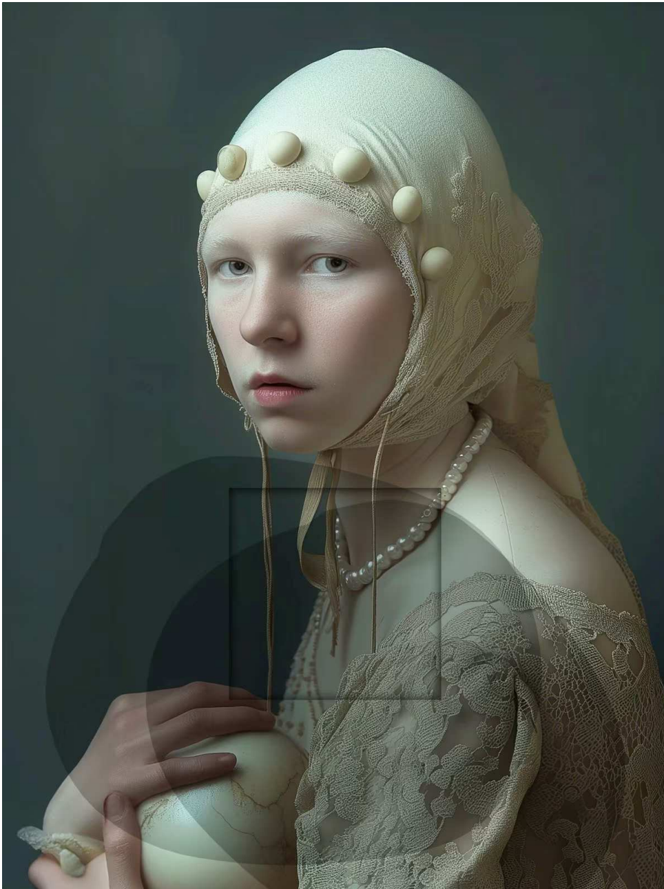
No Man's Land, Matteo Basile (2024). Courtesy of the artist