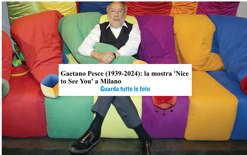
Gaetano Pesce (1939-2024): la mostra 'Nice to See You' a Milano Guarda tutte le foto

INFO: MIA PHOTO FAIR 2024, dall'11 al 14 aprile all'Allianz MiCo Milano