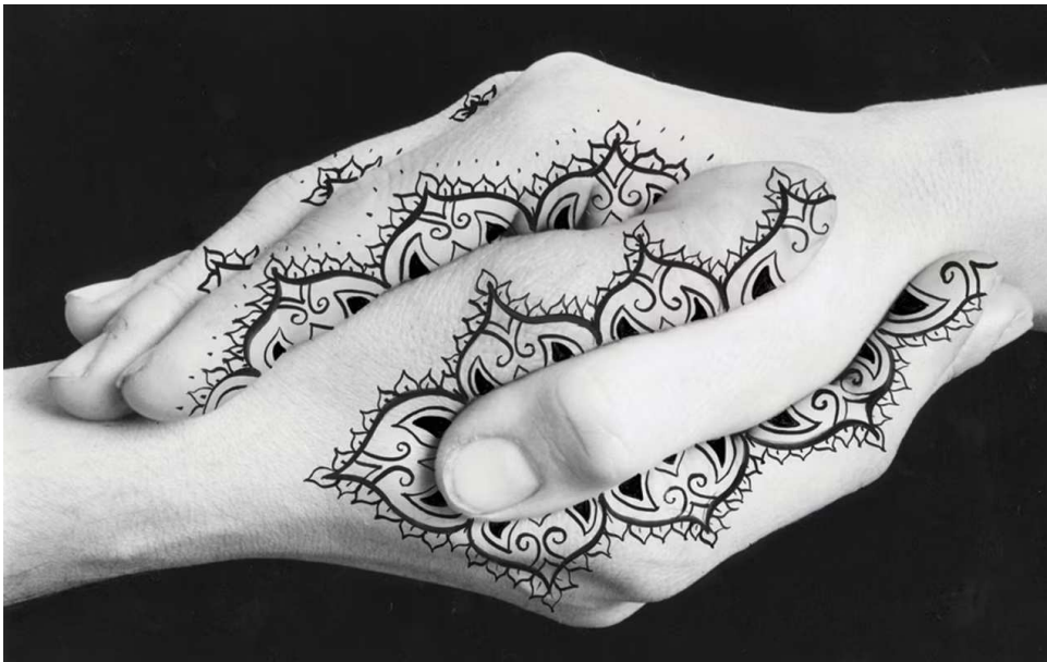
Mia Photo Fair 2024 (Allianz MiCo Milano, 11-14 aprile): Untitled, Shirin Neshat (1996).

C omincia oggi, 11 aprile, il 13esimo MIA Photo Fair , l'appuntamento internazionale d'arte dedicato alla fotografia. La prima e più importante fiera d'arte dedicata alla fotografia in Italia . MIA torna con una veste rinnovata. Tante infatti le novità , dal cambio sede che passa da Superstudio Maxi all'Allianz MiCo, alla nuova direzione affidata a Francesca Malgara.