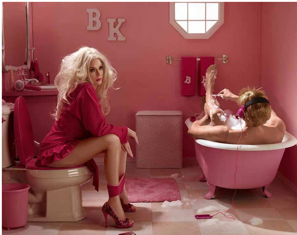
In The Dollhouse: Tub & Toilet, Dina Goldstein. Courtesy Talullah Studio

Il tema scelto per questa edizione è Changing , declinato in tutti i suoi aspetti. Dai diritti civili alla trasformazione sociale, economica, tecnologica... Senza dimenticare il cambiamento climatico. Cresce la qualità delle proposte espositive con l' ingresso di gallerie provenienti da diversi Paesi come Stati Uniti, Iran, Paesi Bassi, Francia e Svizzera per un totale di 100 espositori. Oltre a otto mostre e progetti speciali, 4 premi e 70 gallerie provenienti dall'Italia e dall'estero.