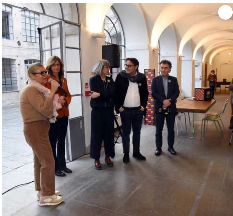
Inaugurate le mostre del progetto "Il passato che saremo" FOTO

Lo scorso venerdì 22 marzo si sono aperte le mostre fotografiche del progetto "Il passato che saremo" che si tengono in due luoghi prestigiosi della città di Biella. Grazie alla collaborazione con il Festival della Fotografia Etica di Lodi sono esposti progetti di fotografi pluripremiati a livello internazionale: Alessandro Cinque, Felipe Fittipaldi, Vincent Tremeau e Isabella Franceschini. Una doppia inaugurazione che ha visto la partecipazione di un folto pubblico.