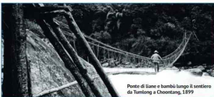
Ponte di liane e bambù lungo il sentiero da Tumlong a Choontang, 1899