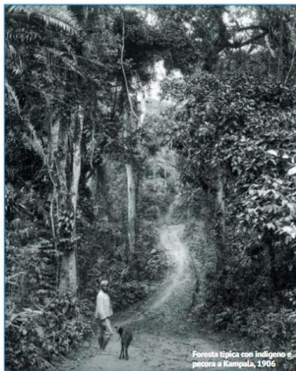
Foresta tipica con indigeno e pecora a Kampala, 1906

nia al Madagascar, da Cuba alla Cambogia, dalle nostre Alpi alle Hawaii, si susseguono storie avvincenti, percorsi indimenticabili, incontri reali o immaginari con personaggi umani e non, tracce che la storia ha lasciato e la natura ripreso, perle botaniche, occhi di guerra, avventure fantastiche, suoni, sapori, odori, paura e bellezza».