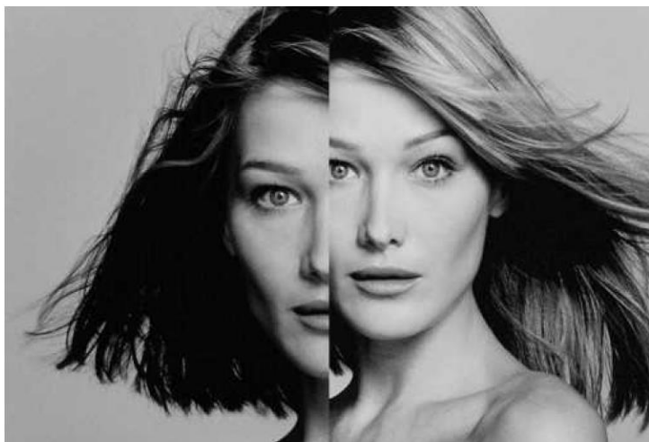
“Volto, anima del corpo“, a Palazzo Ferrero e a Palazzo Gromo Losa a Biella

Dal 12 novembre 2022 al 22 gennaio 2023 nella storica cornice di Biella Piazza, nei due complessi di Palazzo Ferrero e Palazzo Gromo Losa, si terrà la mostra “Volto, anima del corpo“ a cura di Irene Finiguerra e Fabrizio Lava