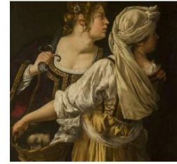
La seduzione virile e ribelle di Giuditta. Caravaggio e Artemisia Gentileschi a Palazzo Barberini