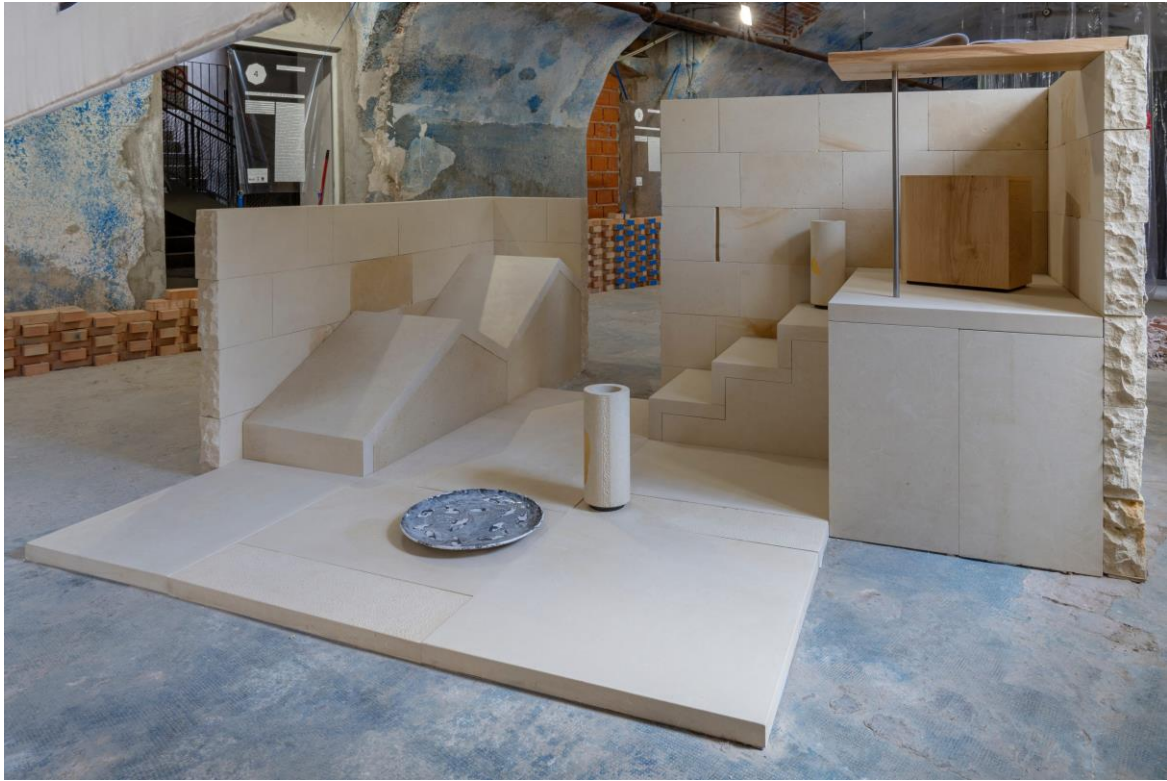
Il progetto vincitore dell'ultima edizione (2019): Gravitazioni di stanze di pietra